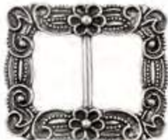
AP 00069 | HERRE

Denne spennen er laget i messing og er tradisjonell og tidløs. Perfekt for den som ønsker seg en gyllen spenne.