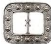
AP 00071 | DAME

Denne spennen tar opp et mønster fra gammel norsk tradisjon.