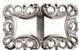
AP 00023 | DAME

“Borrestilen” var en del av vikingtidens ornamentikk. Dette stilrene mønsteret ble funnet ved en gravhaug ved Borre i Vestfold (Mønsterbeskyttet reg. 74998).