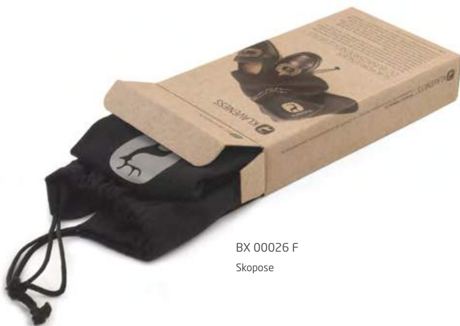
BX 00026 F Skopose