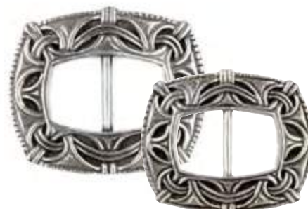
AP 00022 | HERRE AP 00067 | DAME

Spennen er en viktig del av skoen. Denne kommer fra Valdres, og mønsteret kan spores tilbake til 1800-tallet.