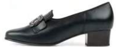
FK 0060 (MED RØD KANT)

TONE 2 | | 2½-8 Neolitt | 35mm ● 201 Sort nappa