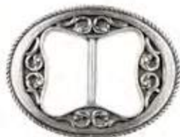
AP 00061 | DAME

Vakkert utformet spenne i et populært design.